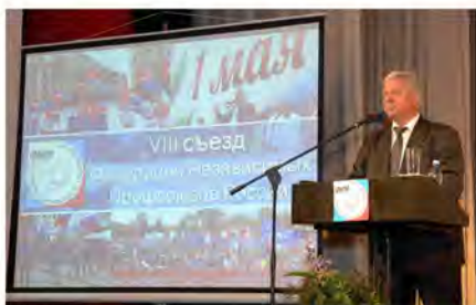
Уважаемые делегаты съезда, уважаемые товарищи!

НА VIII (ВНЕОЧЕРЕДНОМ) СЪЕЗДЕ ФНПР В САНКТ-ПЕТЕРБУРГЕ 29 ОКТЯБРЯ 2013 ГОДА