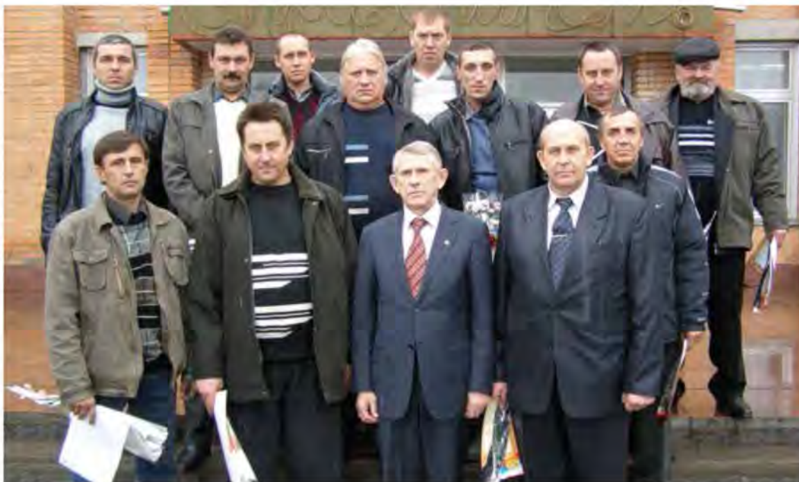
СПК «Большевик» Кореневского района. Первое место по количеству дипломов и благодарностей победителям трудового соревнования

Особо ответственная задача для руководителей и специалистов сельхозпредприятий, экипажей курских комбайнеров и водителей на перевозках зерна - в максимально сжатые сроки и без потерь убрать выращенный урожай. По общему признанию в рабочих коллективах сельхозпредприятий значимым стимулирующим фактором к высокопроизводительному труду стало трудовое соревнование, организованное Комитетом агропромышленного комплекса области и Курским областным комитетом Профсоюза работников АПК.