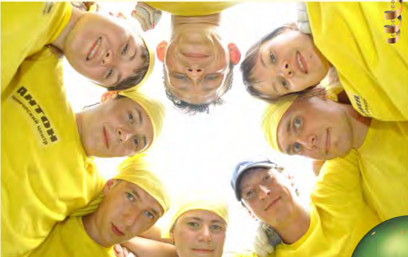
Удмуртская Республика